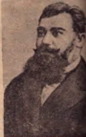
Александр Федорович МОЖАЙСКИЙ

Он вернулся к своему верному другу—огромному лобовому станку. А тот, словно почувствовал своего старого хозяина, врезаясь резцом в металл, тихо пел свою веселую песенку. На глазах староро русского пролетария—токаря Раенко появилась слеза. Он плакал от радости и вдохновения. Д. РЕЧНОВ.